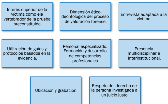
Figura 2. Estándares de calidad de la entrevista forense.

Fuente: elaboración propia. Adaptado de PROMISE, 2019; National Children’s Advocacy Center, 2017; Juárez et al. , 2021.